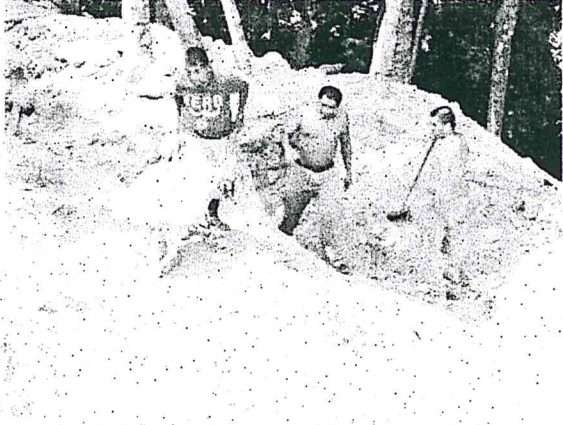
Operativos rellenando A-8